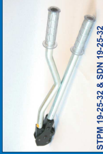
STPM 19-25-32 & SDN 19-25-32