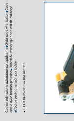
STPM 19-25-32 & SDN 19-25-32